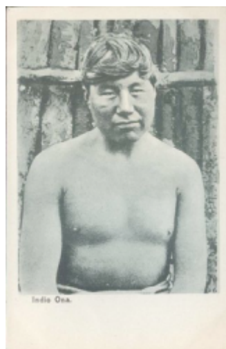
Fig. 4 Indio Ona

El curso se desarrolló en ocho conferencias, a razón de una por semana, entre el 25 de septiembre y el 15 de noviembre. En cuanto al programa, éste se apoyó en la clasificación de Emil Schmidt, [26] para quien la antropología consistía en el estudio comparativo del género humano. Además, se abordaron nociones básicas de antropología física, con foco en el examen de los caracteres somáticos considerados como “típico[s] de la raza”: pigmentación de la piel; de los ojos, orejas; altura y proporciones corporales según las “razas humanas”, características craneales; etc. Durante la última conferencia, realizada en el Museo de La Plata, se trataron cuestiones relativas al hombre fósil y actual argentino (Lehmann-Nitsche, 1921). Al finalizar el curso se obsequió a los presentes una fotografía en formato postal, tomada por el propio Lehmann-Nitsche en su viaje a Tierra del Fuego tan sólo un año antes (1902). En la parte inferior de la imagen se incluyó el siguiente texto: “Indio Ona. Rio Grande de la Tierra del Fuego. Rep. Argentina. Caso típico de Ojo Mongólico. Recuerdo del Curso Libre de Antropología dado en los meses de Setiembre, Octubre y Noviembre de 1903 en la Facultad de Filosofía y Letras de Buenos Aires. Por el Dr. R. Lehmann-Nitsche”. [27] A continuación se muestra la misma postal, sin la inscripción mencionada y posiblemente comercializada por Roberto Rosauer, uno de los más importantes editores de tarjetas postales de la época (ver figura 4).