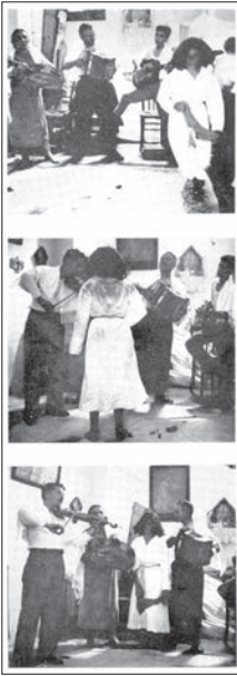
Fig. 2 : « ... et se met à parcourir le périmètre cérémoniel » ; « ... parfois elle s'arrête devant ou parmi les musiciens afin de "prendre" des sons » (De Martino, 1966, Fig. 5, 6, 7).