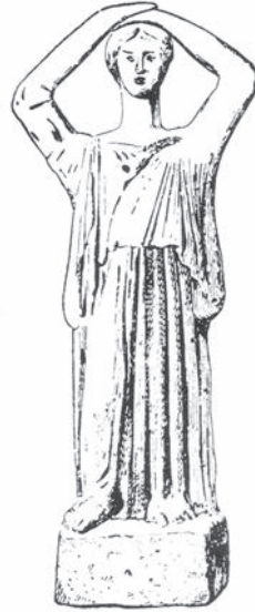
Fig. 7a: « Atlante figurato del pianto », section Materiale folklorico , paroxysme d'une explosion contrôlée de la lamentation funèbre artificielle, Lucania; Fig. 7b: section Mondo antico , statuette de lamentatrice provenant de Tanagra, mains à la tête ( ibid. , Fig. 2 et 47).

Voilà que refait surface l'importance des « documents vivants » dans l'étude de la lamentation funèbre, qui offrirait au chercheur, par la présence visuelle et corporelle, l' enargeia (« clarté, vivacité », au sens de Ginzburg 66 ) nécessaire à une pleine compréhension du phénomène. C'est peut-être cette même enargeia que De Martino cherche à traduire dans l'ouvrage qu'il prépare, en s'assurant de récolter une série d'enregistrements sonores et photographiques « l'un et l'autre indispensables pour ne pas perdre le rapport concret avec la lamentation rituelle comme unité dynamique de parole, de mélodie et de geste 67 ». L'atlas de De Martino est à l'image de l'étendue incroyable que cherche à couvrir sa définition de la lamentation funèbre. Avec son aspect taxinomique, sa démarche semble rester apparentée à une ethnographie, qui, comme celle prônée par Mauss, bâtit des collections d'éléments qui sont plus que de simples exemples à titre d'illus-