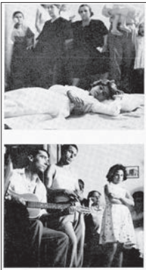
Fig. 3 : « Entre deux cycles de danse, la tarentulée se repose. » ; « ... Parents et public suivent le déroulement du cycle et y participent d'un air préoccupé » (Fig. 25, 26).

les textes antiques exclusivement écrits, de Pline 54 à Eschyle, en passant par Platon. Et pourtant, il parle de l' « image » d'Io. Les propos de Faeta sont éclairants sur ce rapport entre mots et images et la curieuse tension qu'il engendre :