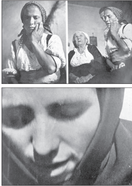
Fig. 4 et 5: « Atlante figurato del pianto », section Materiale folklorico , étapes successives d'une lamentation funèbre artificielle, Lucania (haut); photogramme d'une lamentation funèbre artificielle, Sardaigne (bas) (De Martino, 1958, Fig. 5a,b et 6b).

antico . Dal lamento pagano al pianto di Maria 61 , qui se termine par un surprenant « Atlas figuré de la lamentation » ( Atlante figurato del pianto ) composé de 66 images. Le titre n'est évidemment pas sans rappeler l'atlas Mnemosyne de Warburg (inachevé, 1929), et fait contraste avec le vocabulaire anthropologique de cette époque 62 .